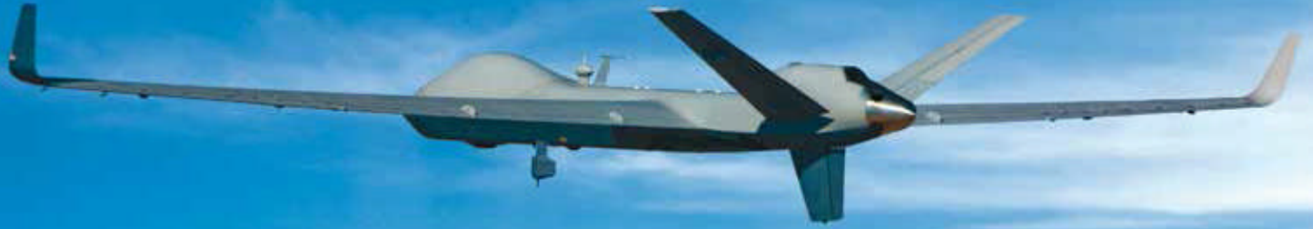
MALE UAS Predator B – Guardian Eagle